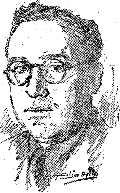
Don Agustín del Río Cisneros

cipios vigentes, ligados a la existencia colectiva, sin deformación ni adulteración por cuestiones verbalistas. Hemos dicho en estas columnas que las formas de gobierno se suceden por los gérmenes de corrupción o degeneración que llevan dentro, y que lo fundamental residía en la armonía de los principios